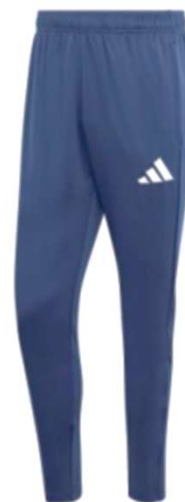
Pantalon 100% polyester recyclé