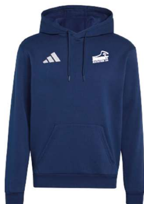
Sweat capuche 70% coton 30% polyester