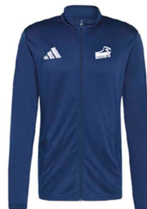
Veste zippée 100% polyester recyclé