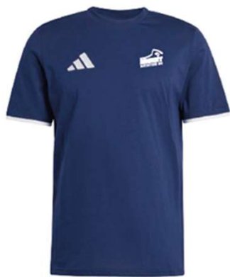
Tee-shirt 100% coton