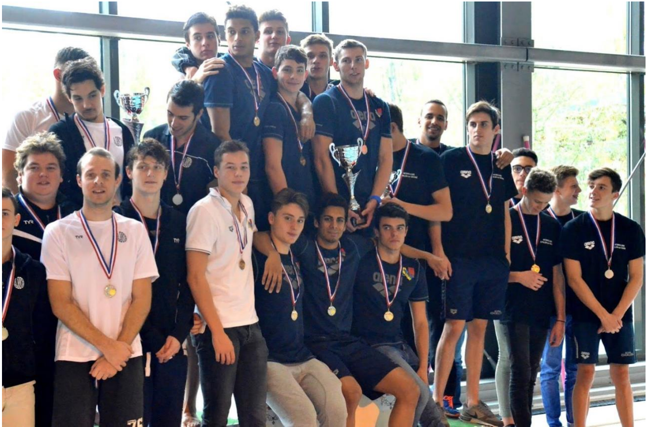
1ier, Alliance Dijon Natation - 2° Alliance Natation Besançon - 3° Cercle Nautique Chalonnais

Le 6 novembre : Nous étions à La Fayette, une organisation au pied levé, rendue possible grâce à la Ville de Besançon, qui répondait présent suite au forfait de la Citédo de Sochaux, permettant à 220 nageuses et nageurs d'en découdre pour le District-Est (Doubs, Haute-Saône et Territoire de Belfort), et pour le championnat de France Interclubs par Équipes Toutes Catégories. Nos Équipes 2 et suivantes contribuent à ce que l'ensemble du club termine 2° de la ligue de Bourgogne Franche-Comté et juste derrière le CN Chalon sur Saône. Pour cet Interclubs 2017, nous remercions nos 90 nageuses et nageurs (sur Lons le Saunier et La Fayette), leurs entraîneurs, mais aussi l'ensemble de nos Bénévoles et Officiels qui ont permis la très bonne organisation sans faille locale de la poule du District-Est.