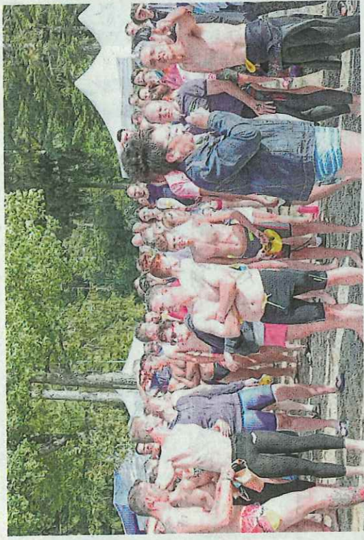
Le dernier briefing pour les nageurs est capital. Juste avant le départ de l'épreuve, il s'agit de repérer le tracé dans l'eau et de retenir l'ordre des bouées qui servent de balises afin d'éviter de perdre de précieuses secondes une fois la course lancée.

Après l'effort... le réconfort. Sur le stand du ravitaillement, passage obligé après la course, des fruits et de l'eau attendaient les nageurs. Après cinq kilomètres de nage dans le lac, les premiers arrivés sont les premiers servis.