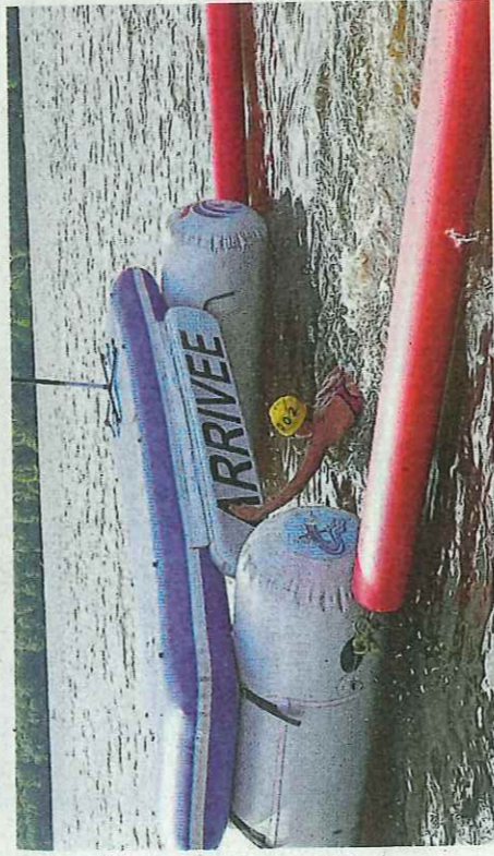
Ultime action pour les nageurs, après ces kilomètres de crawl intense dans l'eau du lac, venir toucher le panneau « Arrivée » afin de stopper le chronomètre. Certaines arrivées se font d'ailleurs au sprint comme ce fut le cas pour la deuxième place du 5 000 m.