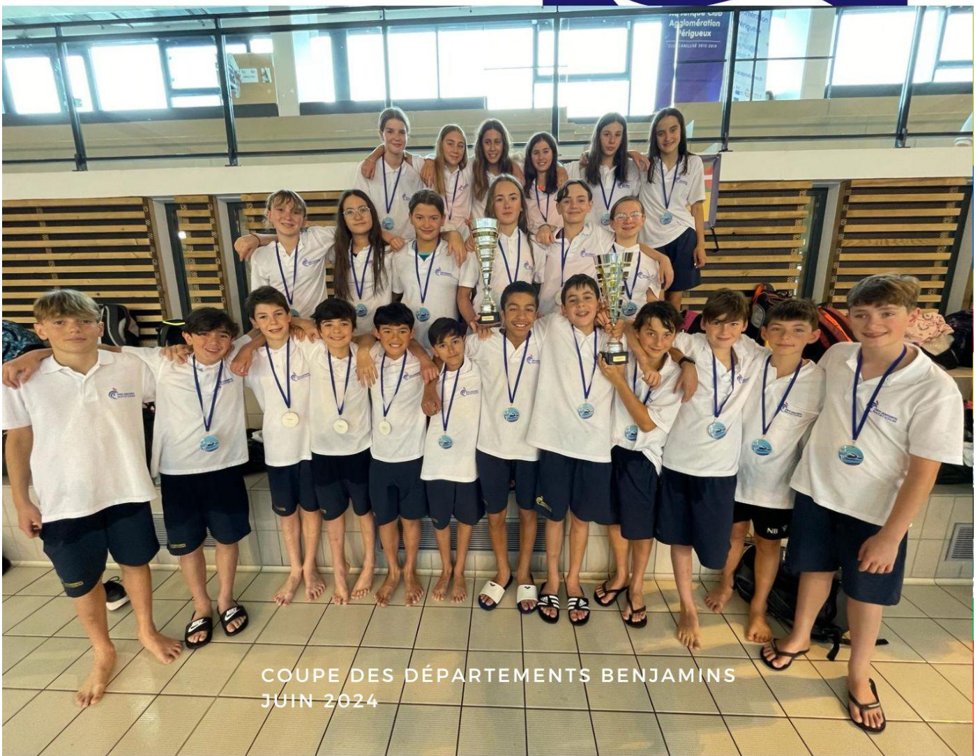
COUPE DES DÉPARTEMENTS BENJAMINS JUIN 2024

Comité départemental de natation des Pyrénées-Atlantiques